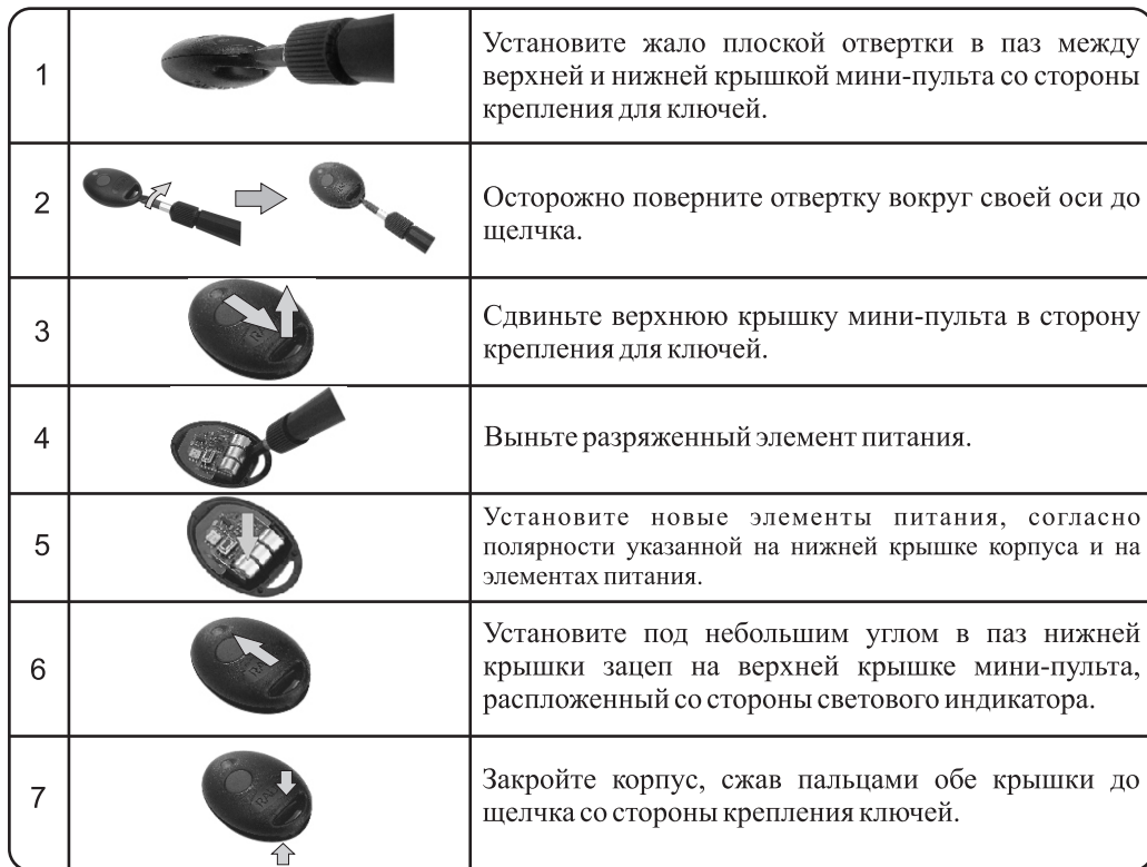
Таблица 1. Замена элемента питания